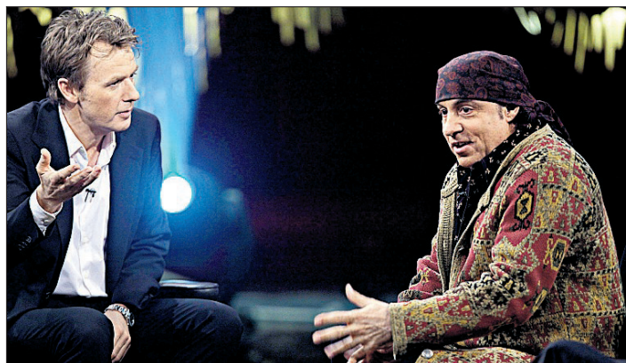
Fredrik Skavlan er klar for to nye sesonger på NRK og SVT, her med Steven Van Zandt (Little Steven) i studio.