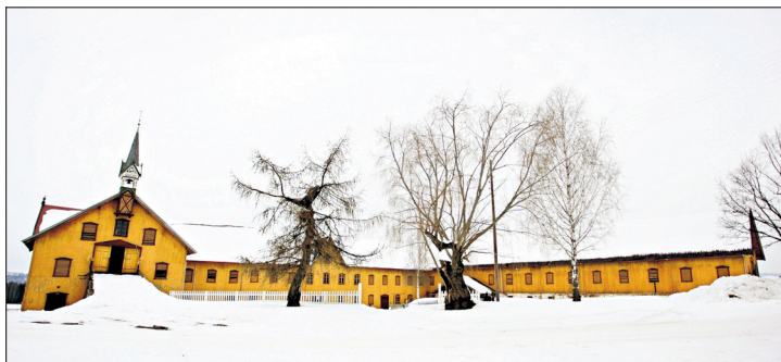
Horne gård har en av de største låvene i Norge, med 2500 kvadratmeter grunnflate som ingen har bruk for lenger.